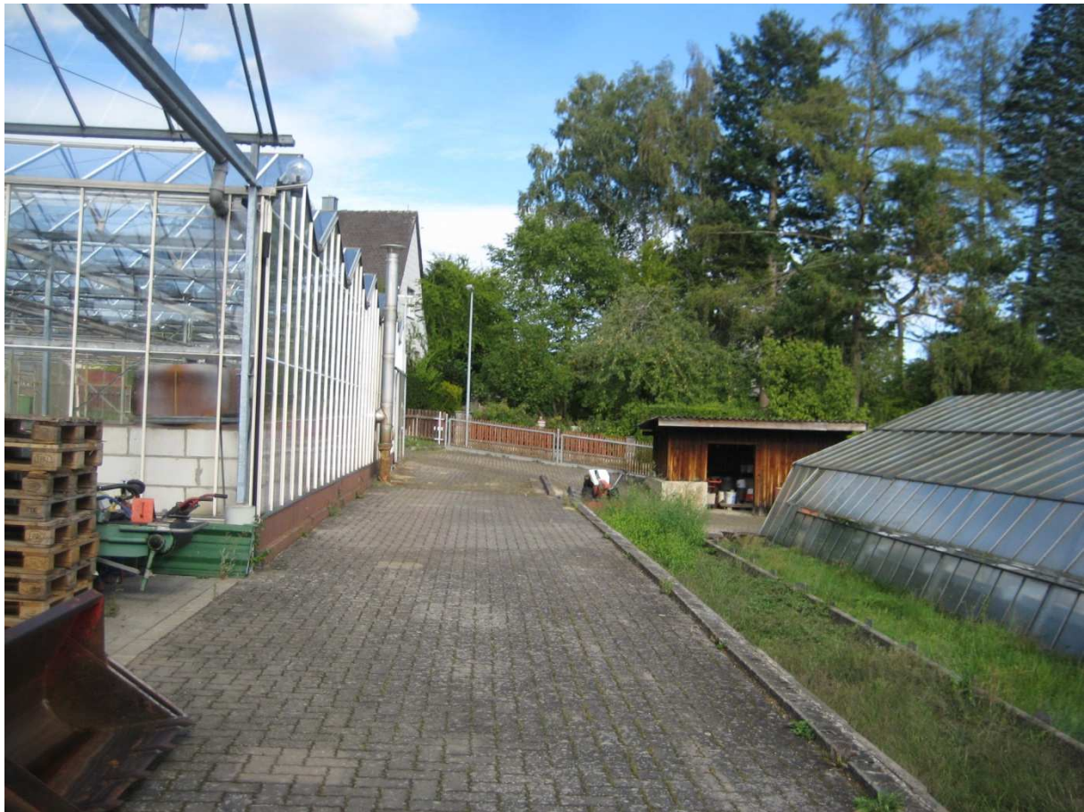
Abbildung 4: Gärtnereigelände im Geltungsbereich

Im westlichen Geltungsbereich ist ein Grundstück bereits mit einem Einzelhaus mit Ziergarten bebaut. Die eingrünende, abschnittsweise geschnittene Hecke sitzt sich überwiegend aus Laubsträuchern in verschiedenen Arten und Sorten zusammen. Die noch unbebauten Grundstücke im westlichen Geltungsbereich können als mäßig trockenes bis frisches Intensivgrünland angesprochen werden (vgl. Abbildung 5). Östlich des bebauten Grundstücks werden kleine Teilflächen als kleine Bolzflächen mit 2 Toren und einem Trampolin durch die Nachbarn genutzt.