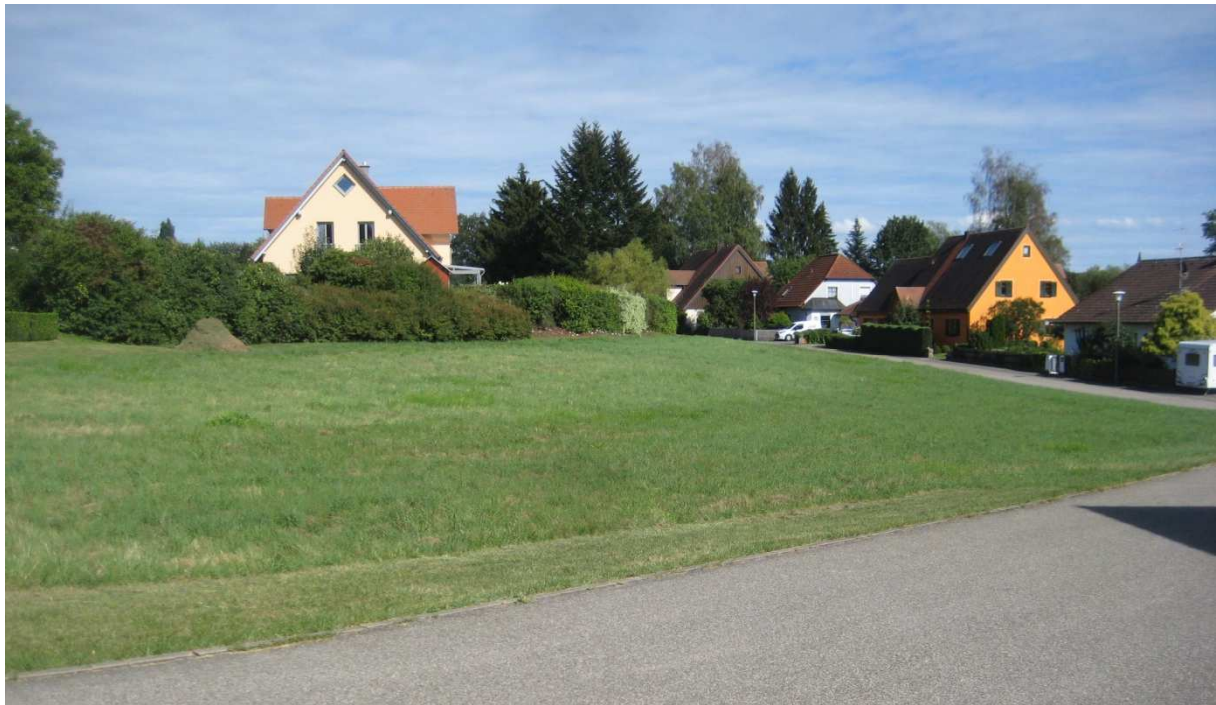
Abbildung 5: Grünland im westlichen Geltungsbereich

Die Grünlandflächen zwischen der bebauten Parzelle Nr. 4 und der Gärtnerei liegen brach bzw. werden zurzeit nur extensiv bewirtschaftet. Neben typischen Grünlandarten wie Löwenzahn, Gemeiner Schafgarbe, Wiesen-Lieschgras, Rot-Klee, Wilder Möhre, Glatthafer, weisen in geringen, punktuell auftretenden Anteilen Echtes Labkraut, Kleiner Wiesenknopf oder Wiesen-Flockenblume auf abschnittsweise etwas magerere, trockenere Verhältnisse hin. Westlich der Bebauung führt ein schmaler Grünweg nach Norden auf die Jahnstraße. An der Geltungsbereichsgrenze zwischen dem Grünland und dem bebauten Grundstück Jahnstraße 3 wächst eine gemischte, gut strukturierte Hecke mit heimischen Laub- und Ziergehölze wie Spitz-Ahorn, Haselnuss, Felsenbirne, Flieder. Am Fuß der Hecke wächst verstärkt Brombeergebüsch. Auf der Geltungsbereichsgrenze südlich der Grünlandbrache steht eine markante alte Kopfweide mit einem Stammdurchmesser über 100 cm.