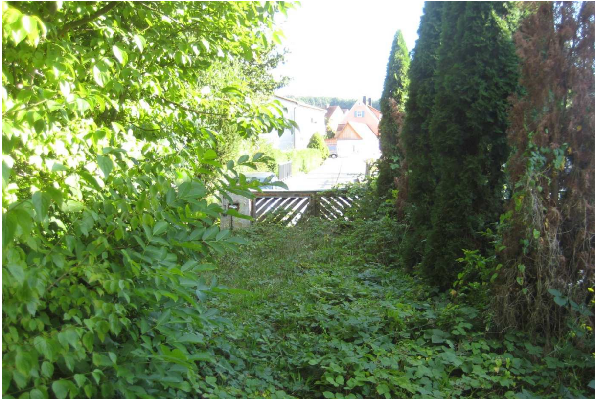
Abbildung 6: Eingewachsene ehemalige Zufahrt im Bereich der Grünfläche für die Niederschlagswasserrückhaltung und -ableitung

Walnuss, Berg- und Spitz-Ahorn, Pfaffenhütchen, Schwarzer Holunder, Kornelkirsche, Mahonie, Efeu vertreten.