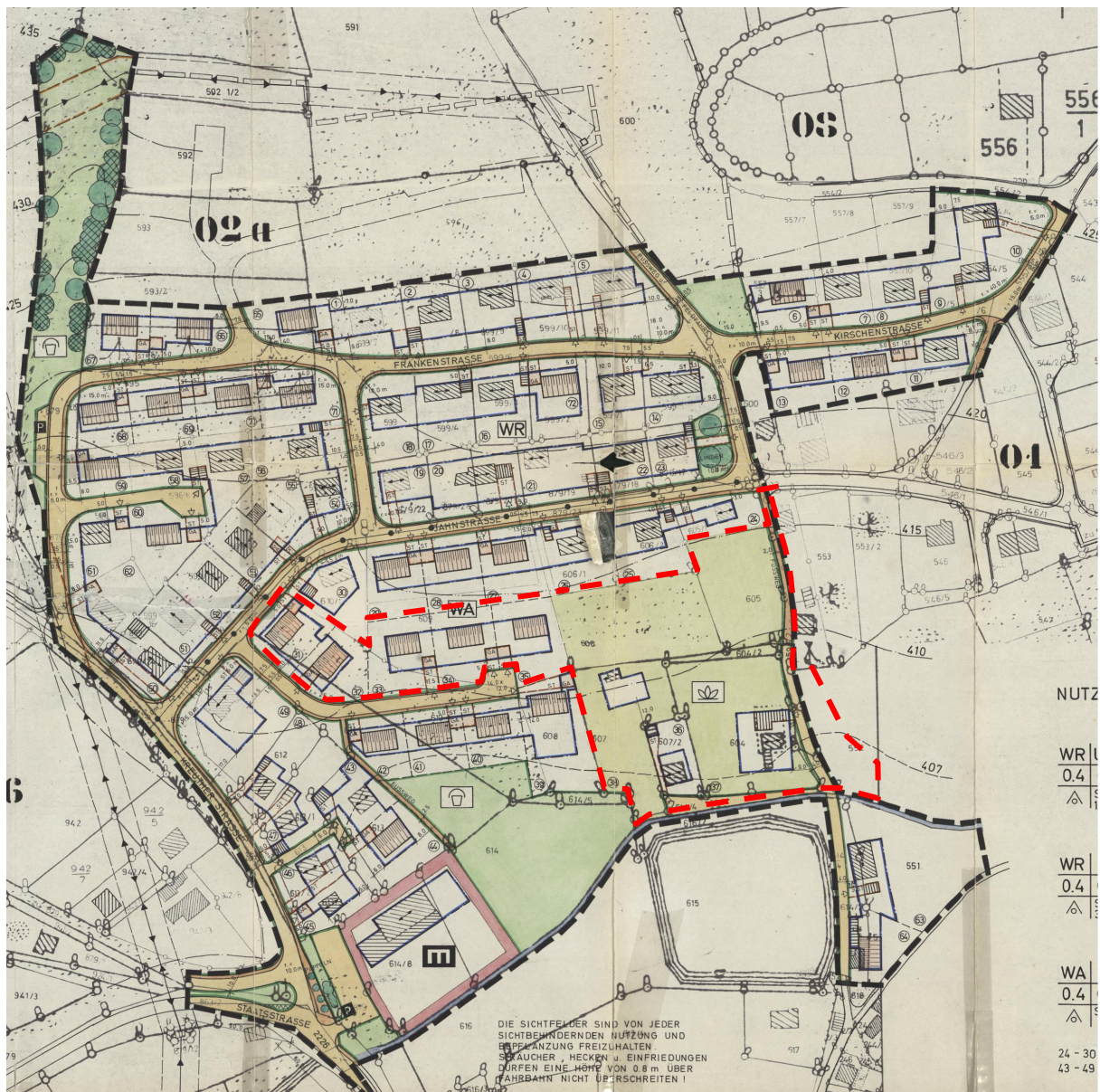
Abbildung 2: Ausschnitt des ursprünglichen Bebauungsplans aus dem Jahr 1977 mit Kennzeichnung des Änderungsbereichs der 4. Bebauungsplanänderung

Für die aktuelle 4. Bebauungsplanänderung wurde das ursprünglich mit der Hand gezeichnete Planblatt innerhalb des Änderungsbereichs digital neu gezeichnet und städtebaulich neu geordnet. Es gilt der im Planblatt dargestellte Geltungsbereich, der nur eine Teilfläche des ursprünglichen Geltungsbereichs umfasst (vgl. Abbildung 2).