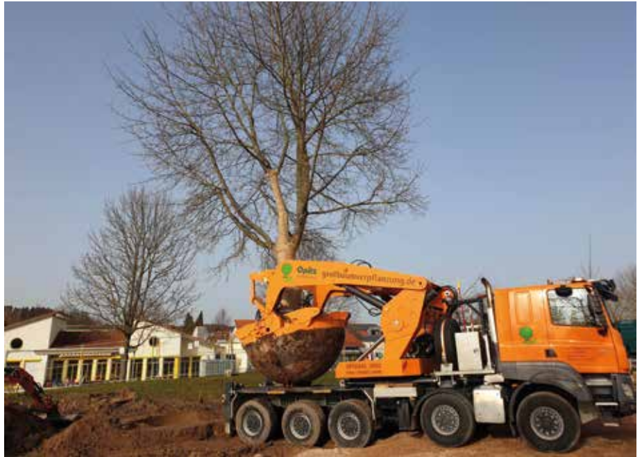
Die Rundspatenmaschine mit dem Ahornbaum vor dem vorbereiteten Pflanzloch.

Der etwa 15 Meter hohe Spitzahorn im Garten des städtischen Kindergartens musste einem Erweiterungsbauprojekt weichen, aber er wurde nicht einfach umgesägt, sondern einige Meter weiter nach Süden verpflanzt. Damit im später im erweiterten Kindergarten mit Krippe noch mehr Kinder im Garten genügend Platz zum Spielen haben, wurde das Grundstück nach Süden verlängert. Leider im Weg für die Erweiterung war ein großer Ahornbaum, dessen Schatten die Kinder im Sommer liebten. Damit sie auch weiterhin die Kinder im Schatten spielen können, verpflanzte die heimische Firma Großbaumverpflanzung Opitz mit ihrer Rundspatenmaschine nicht nur den großen Ahorn, den sie bereits vor 20 Jahren für die Eröffnung des Kindergartens hierher verpflanzt hatten und der gut weitergewachsen war, sondern auch noch eine Hainbuche vom Bauhof, einen Kirschbaum und eine Linde; dazu noch zehn kleine Bäume und Sträucher. Damit der Baum Chancen hat, gut an- und weiterzuwachsen, wurden schon länger vor der Maßnahme seine Wurzeln rundum abgestochen und der Zwischenraum zum Boden mit lockerer Erde aufgefüllt. So bildete er hier viele neue Wurzeln, mit denen er dann ins vorbereitete Pflanzloch gesetzt wurde. An vier Punkten im Boden mit Stahlseilen verankert und die Stämme mit Schilfrohmatten und Jutebandagen geschützt, können die