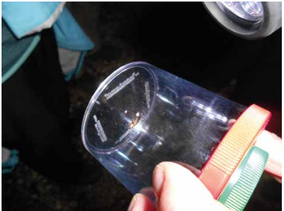
Ein leuchtendes Glühwürmchen, das kurzzeitig in einer Becherlupe gefangen war, war für manchen Exkursionsteilnehmer eine neue Naturerfahrung.

hen. Die Weibchen bleiben dabei meist auf Stängeln und Ästen sitzen, während die Männchen auf der Suche nach einer Partnerin den Wald durchkämmen. Glühwürmchenlarven ernähren sich von Schnecken und überwintern. Es kommt nicht von ungefähr, dass in diesem Waldrevier so viele Glühwürmchen zu sehen sind. „Bodenfeuchte, dunkle Laubwälder und insektizidfreie Flächen brauchen die kleine Insekten, um zu überleben“, weiß Schäffer zu berichten.