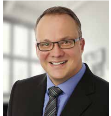
Ralf Beyer, 1. Bürgermeister