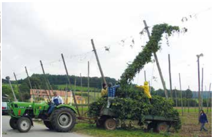
Die letzte Rebe Heidecker Stadthopfens fiel am 29. August 2002.