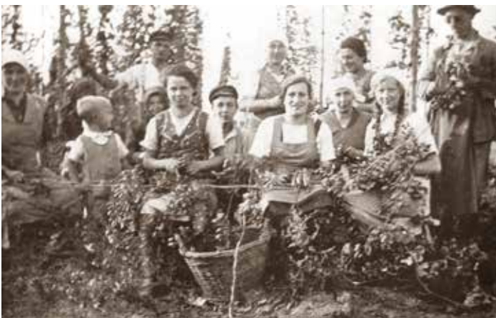
Hopfensblouder am Acker.