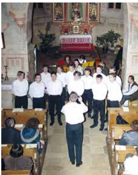
Oben Cantus Sacralis bei ihrem Auftritt in der Kapell im Jahr 2000, rechts 19 Jahre später im Kapell-Jubiläumsjahr.