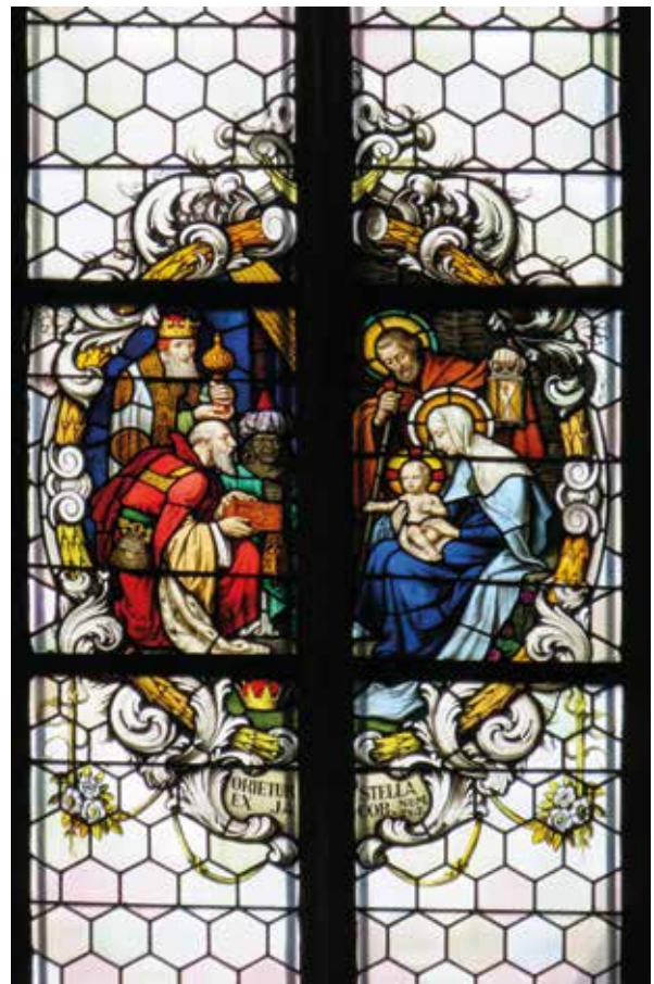
Das Glasfenster im Chor der Pfarrkirche St. Johannes der Täufer zeigt die Anbetung des Christkinds durch die drei Weisen.

Spenden kommen zu gleichen Teilen der Chorarbeit und der Pfarrgemeinde zugute.