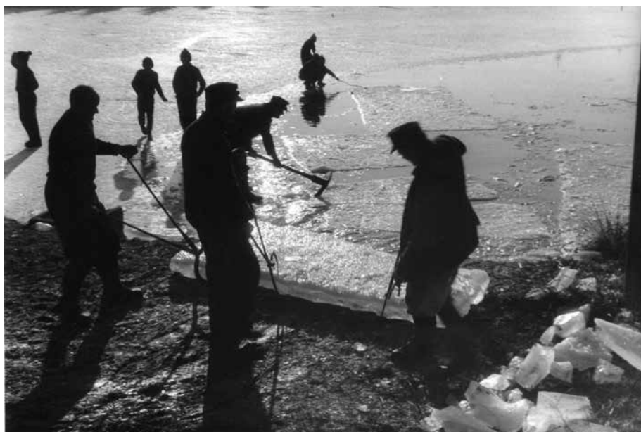
„Eisen“ am Wäschweiher.