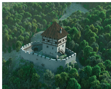
Virtuelle Rekonstruktion der Burg Altenheideck: Büro für Burgenforschung Dr. Zeune / ReUnion 2008

Informationstafeln mit virtuellen Rekonstruktionen und Panoramatafeln an den beiden Burgstätten.