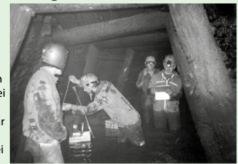
1986 vermaß die Höhlen- und Karstgruppe Greding einen Bergwerkstollen in Laibstadt.

Auf der Wiese neben der Thalach wurde 1990 ein Stück Bergwerk-Stollen nachgebaut. Man verwendete dabei auch Originalstempel, die mehr als 250 Jahre alt sind und 1986 bei Baumaßnahmen in Laibstadt geborgen wurden.